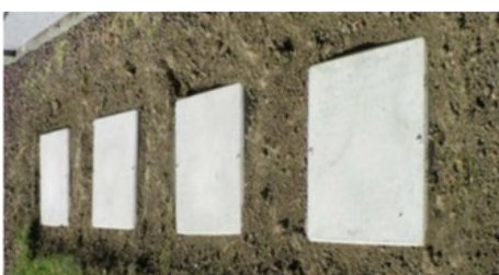
Colombarium et cavernes (Photos d'illustration)