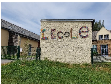
Réalisation des jeunes en 2019

Le Conseil Municipal des Jeunes actuellement en place perdurera jusqu'à la fin de l'année 2020. Des actions, en faveur des jeunes, seront proposées sur les derniers mois de l'année et notamment une journée « jeunes citoyens », en association avec la « Journée Citoyenne », le samedi 10 octobre 2020.